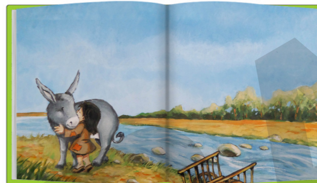
Ilustración Escena del capítulo xxxvii La carretilla

“En el arroyo grande, que la lluvia había dilatado hasta la viña, nos encontramos atascada una vieja carretilla, perdida toda bajo su carga de hierba y de naranjas una niña rota y sucia un borricuelo, más pequeño y más flaco que Platero. Platero sacó carretilla y rucio del atolladero, y les subió la cuesta”. La niña sonríe “como si el sol de la tarde le encendiese una aurora tras sus tiznadas lágrimas”.