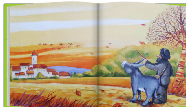
Ilustración Escena del capítulo lxxxviii: Tarde de octubre

“Han pasado las vacaciones y, con las primeras hojas amarillas, los niños han vuelto al colegio”. El sol se pone. Predominio del color amarillo en el paisaje. Hojas secas caídas en el camino. Sopla un viento frío. El poeta señala con una rama seca al cielo. Platero contempla una bandada de patos que vuelan hacia el sur, en dirección opuesta al viento. “Los árboles amarillos alumbran vivamente como suaves hogueras de oro, nuestro caminar”