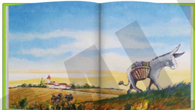
Ilustración Escena del capítulo xxii: La vendimia

Hombres en la vendimia. Platero y su amo pasan delante de los burros cargados hasta los topos de racimos de uvas doradas. Platero pasa ligero con su pequeña carga, mientras los otros le miran mal (es obvio para todos que es un burro mimado)