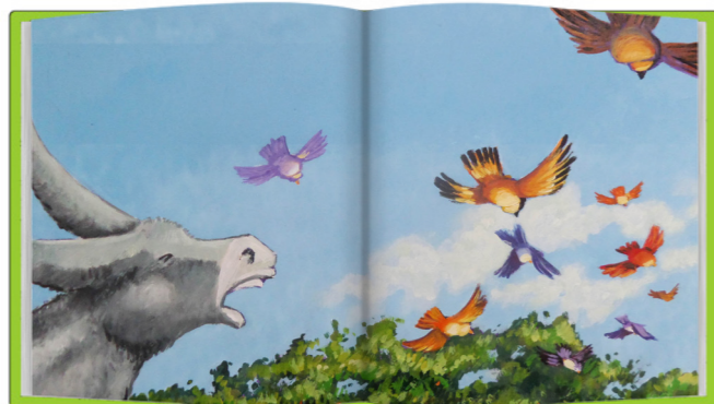
Ilustración Escena del capítulo xxxii: Libertad

Están cerca de un bebedero, lugar de un prado donde acuden a beber los pájaros, donde unos niños han puesto una red para cazar pájaros. Ya hay un pájaro enredado en ella. Los pájaros alzan el vuelo en bandada desde un pinar cercano.